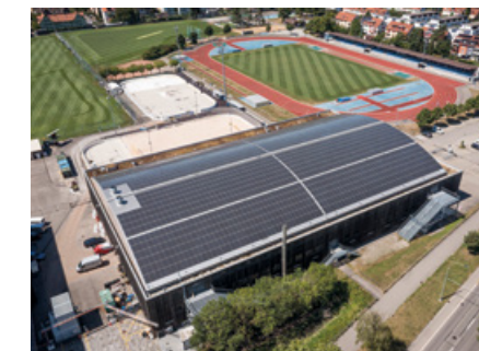
Fotovoltaikanlage Eishalle Deutweg

Mit der Wahl des hochwertigsten Produkts, KlimaGold, haben Sie auch die Möglichkeit, symbolisch auszuwählen, von welcher Fotovoltaikanlage von Stadtwerk Winterthur Sie den Strom beziehen möchten. Damit unterstreichen Sie Ihr Bekenntnis zur Energiewende und zum lokalen Solarstrom. Ihre Wunschanlage auswählen, können Sie auf stadtwerk.winterthur.ch/strom