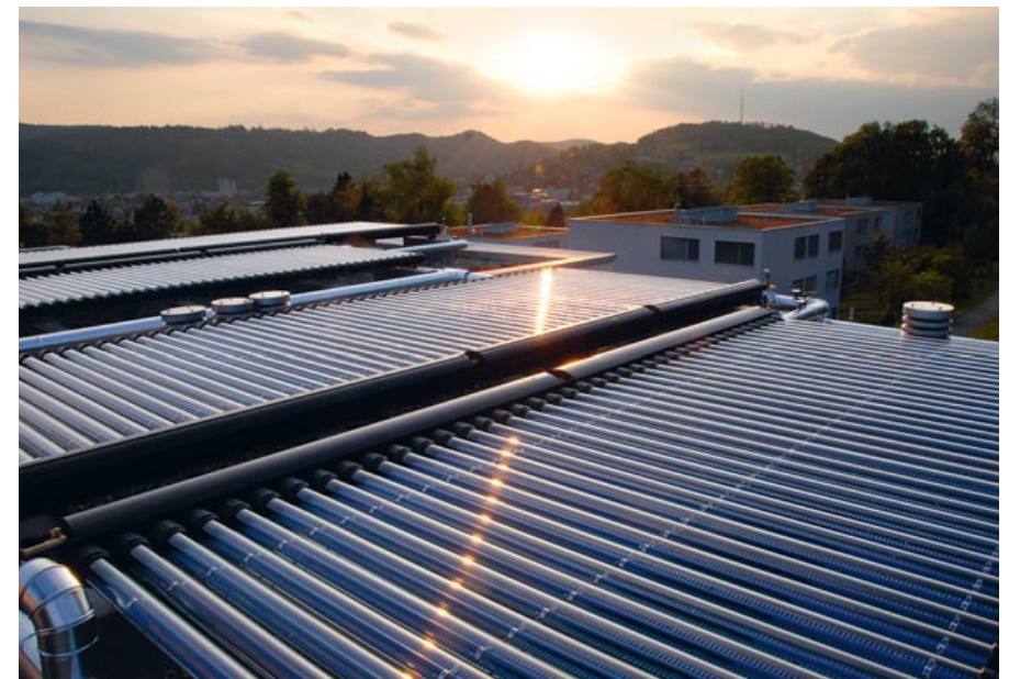
Solarthermie-Anlage als Beispiel eines Anlagen-Contractings.

Als erstes bestimmen wir gemeinsam Ihre Bedürfnisse. Anhand dieser erarbeiten wir eine auf Sie zugeschnittene Energie-Versorgungslösung. Je nach Wunsch übernehmen wir für Sie Planung, Bau, Finanzierung und Instandhaltung der Anlage.